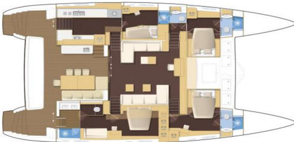
Căminul lateral, 4 cabine / Lateral galley, 4 cabin version