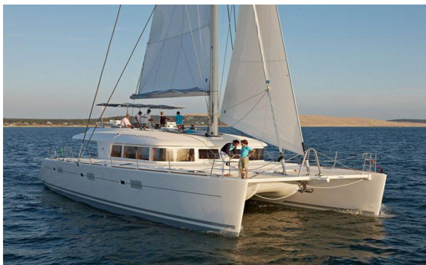
Lagoon 620 - Arcachon juin 2009 - Mention obligatoire / Mandatory credit: Photo Nicolas Clariès

photo no contractuelle / not contractual picture