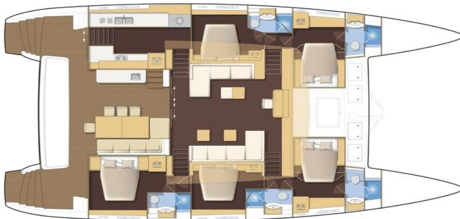
Cuisines latérale, 5 cabines / Lateral galley, 5 cabin version