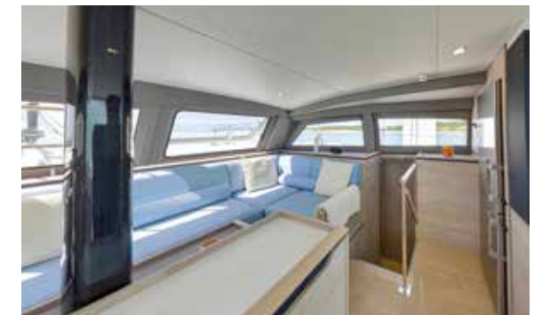
The saloon bench seat offers a direct view of the horizon and the navigation instruments.

L'accès aux équipements techniques est simple pour faciliter la maintenance opérationnelle.