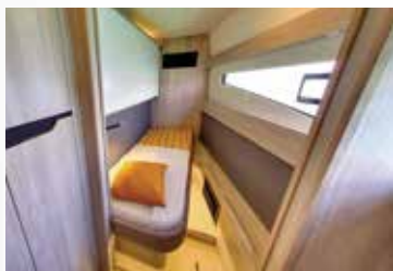
A convertible space with amovable bunk bed Un espace convertible avec un lit superposé amovible

La cabine avant tribord propose plusieurs configurations pour répondre aux besoins des propriétaires :