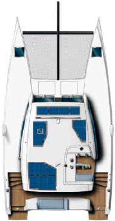
Deck and raised helm station ( Deck floor & solar panels optional )

Pont et poste de pilotage surélevé ( Pont en teck et panneaux solaires en option )