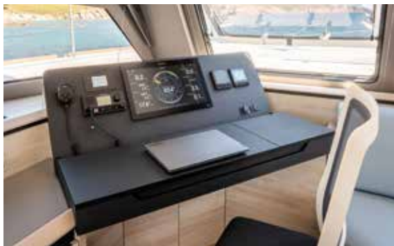
Diagonally across, the chart table with a comfortable removable armchair offers a clear view of the bows and the horizon.

Un poste de barre unique qui comprend deux espaces distincts.