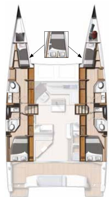
4-Cabin / 4-heads version ( Extension for double berth in forward cabins optional )

Version propriétaire 3 Cabines / 2 salles d'eau ( cabine skipper en option )