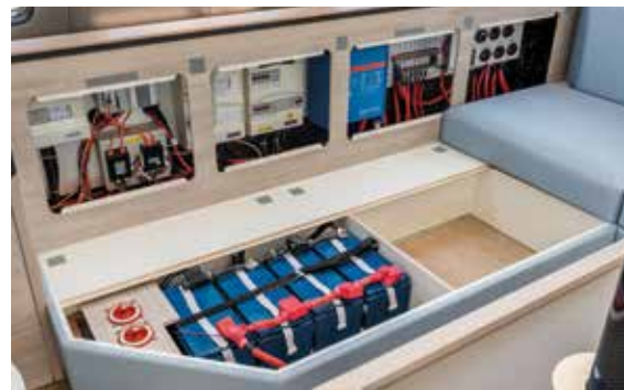
Easy access to technical equipment to facilitate operational maintenance.

Disposée en diagonale, la table à carte équipée d'un fauteuil confortable amovible, offre une vue dégagée sur les étraves et l'horizon.