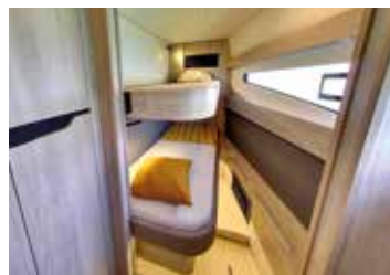
A child's Cabin Une cabine pour enfants