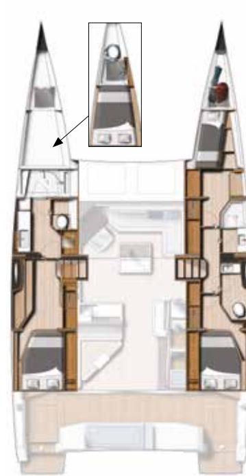
Owner's version: 3 Cabin / 2 heads ( Skipper's cabin optional )

Nacelle et cockpit ( Pont en teck en option )