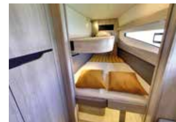
Cabin layout with two or three berth Une cabine avec lit double ou 3 couchettes