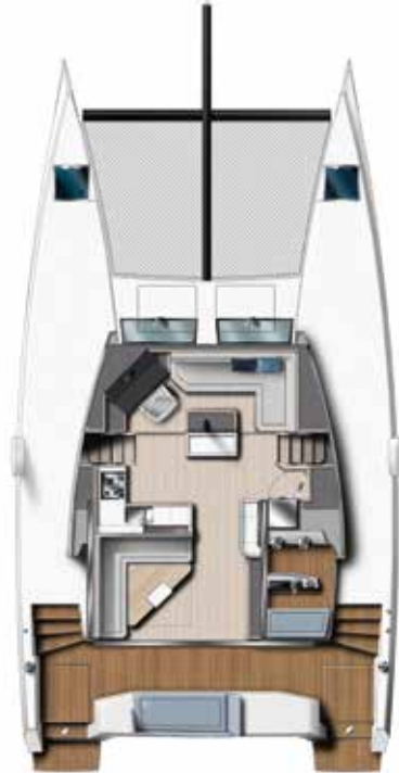
Nacelle and cockpit ( Deck floor optional )

Pont et poste de pilotage surélevé ( Pont en teck et panneaux solaires en option )