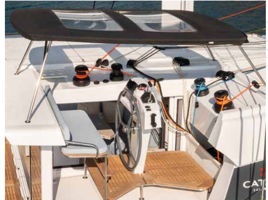
A single helm station that comprises two distinct spaces.

Il bénéficie d'une excellente visibilité sur les deux coques et sur les jupes arrière ce qui rend les manœuvres faciles et rassurantes tandis que l'ergonomie compacte de l'accastillage de navigation permet de réaliser tous les réglages au même endroit, protégé des éléments. Ce nouvel espace de vie permet d'accueillir confortablement 5 personnes ce qui en fait un endroit idéal pour partager des moments de vie au large.