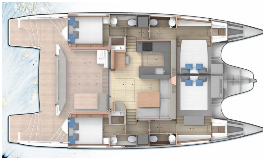
Cuisine ouverte sur le carré avec :

Version Propriétaires 4 cabines doubles et 4 salles d'eau avec douche séparée